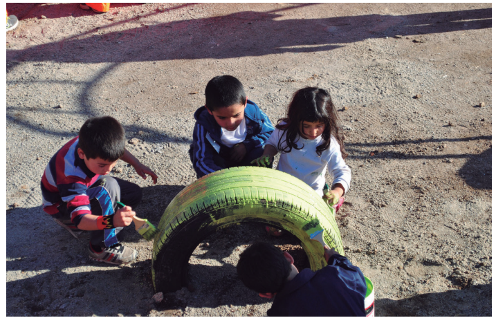
En los inicios usando materiales económicos pero poco sustentables, San Bernardo 2011

En 2015 también se institucionaliza el seguimiento y evaluación de los proyectos, incorporando profesionales que se hacen cargo de esta función específica. Si bien la sustentabilidad de las