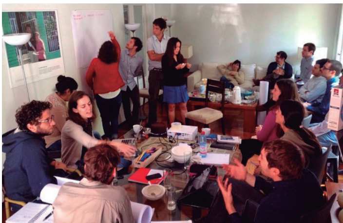
Reunión reflexiva de equipo