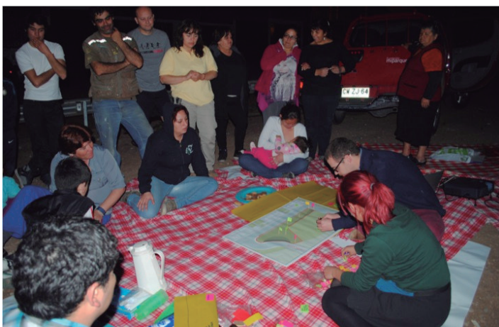
Taller de diseño participativo, Huechuraba 2012