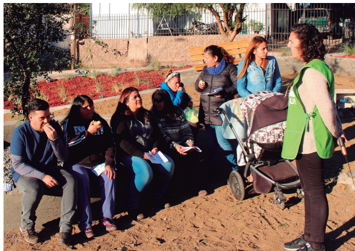
Seguimiento "Plaza Alavinia Olivera", San Felipe 2017