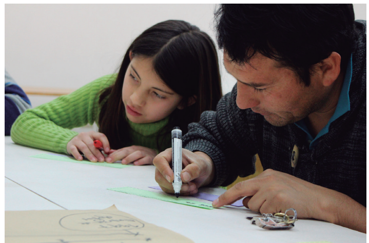
Taller participativo Plaza Claudio Arrau II, Colina