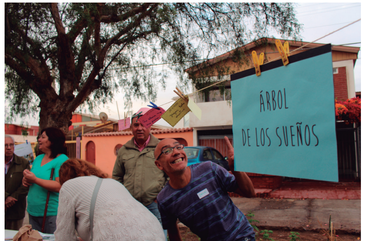
Taller participativo Plaza Villa Azolas, Arica