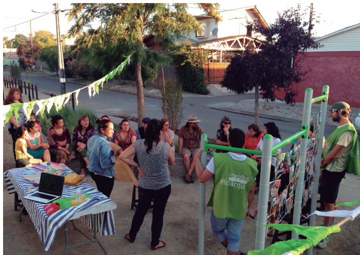
Acompañamiento "Plaza Nueva Vida", Recoleta 2015

En esta línea, el Área de Seguimiento ha desarrollado ciertas pautas para analizar la mantención del mobiliario y de las especies, además de adentrarse de manera más bien cualitativa al uso que se le da al área verde post intervención. Si durante la evaluación del lugar se reconocen falencias, estos aprendizajes sobre posibles materialidades o especies que tengan poca sustentabilidad sirven para futuras decisiones en otros proyectos. Lo mismo ocurre sobre el uso del área verde en la distribución y diseño de los espacios al interior de ésta. Si es que se evidencia deterioro de la plaza, Mi Parque se compromete a cambiar el material que sufrió algún daño.