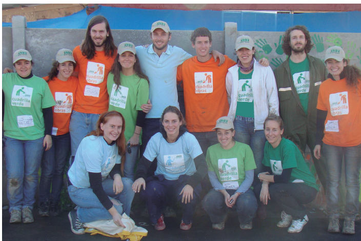
Parte del equipo inicial, junio 2010

Como respuesta a lo anterior, a fines de 2012 y principios de 2013, se institucionalizan ciertas formas de trabajo con el fin de no depender de personalismos en ciertos cargos y se instauran reflexiones en los equipos que permitieron caracterizar los programas y el modelo en general. De este modo, se genera una primera sistematización interna que levanta una descripción de cómo se hacen las cosas en la fundación, lo cual institucionaliza el modelo de trabajo. Junto a esto, se revisa la misión y la visión, al mismo tiempo se generan pautas para el desarrollo de los talleres con las comunidades. Se establece un mínimo de tiempo para la intervención y se reconoce por parte del equipo Mi Parque una marcada mejora en los estándares de construcción y diseño de las áreas verdes. En