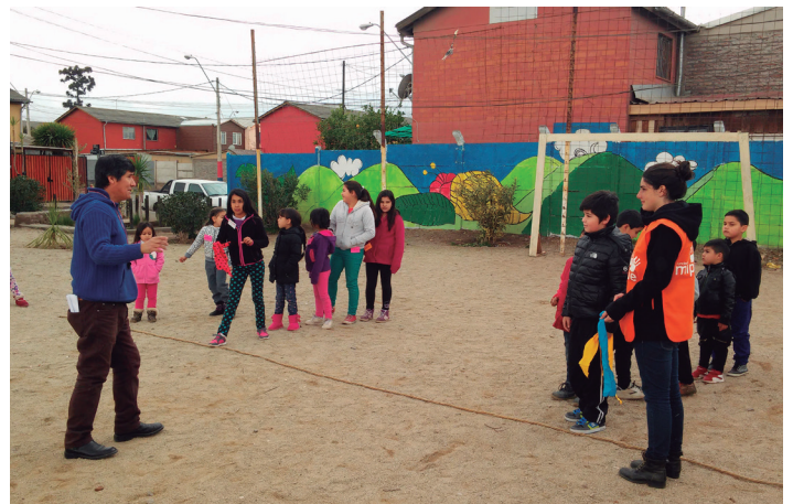
Acompañamiento Plaza Las Carmelitas, San Bernardo

En 2016 se reconocen dificultades para hacer el acompañamiento comunitario de manera adecuada. Hasta ese momento, el acompañamiento era principalmente realizado por voluntarios, quienes al trabajar de manera externa a la fundación, no eran capaces de cumplir las exigencias de lo que se les demandaba. A juicio de los profesionales del área social, esto debilita el buen desarrollo de esta etapa. Además, se indica que esta instancia debiera mejorarse para mantener una continuidad en los procesos. A partir de la preocupación por el monitoreo, se han levantado diversos mecanismos para fortalecer el acompañamiento comunitario, pero hasta hoy se reconoce como un tema que presenta debilidades que han generado distintas reflexiones y propuestas de innovación para esta etapa de la intervención.