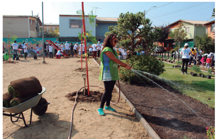
Encargada de Agropaisaje

áreas verdes recuperadas siempre fue una preocupación de Mi Parque, no existía un área destinada a realizar evaluaciones del mantenimiento de las plazas. Así, se busca tener evaluaciones y aprendizajes sobre qué funciona y qué no en las intervenciones y diseños urbanos realizados por la fundación. Aquí es importante enfatizar la incorporación de profesionales de la agronomía y paisajismo para esta tarea, lo que refuerza la sustentabilidad de los proyectos mediante una evaluación constante del mantenimiento de las especies vegetales, de las materialidades en el mobiliario comunitario instalado en las plazas, -juegos, bancas, etc.- el uso y la organización social en torno a las áreas verdes recuperadas participativamente. A partir de los hallazgos de estos procesos se mejoran las intervenciones, se fortalece el diseño y se optimizan las decisiones sobre los temas observados. Al mismo tiempo se comienzan a desarrollar estrategias comunitarias para pensar con los vecinos y municipalidades acerca de la sostenibilidad de los espacios recuperados.