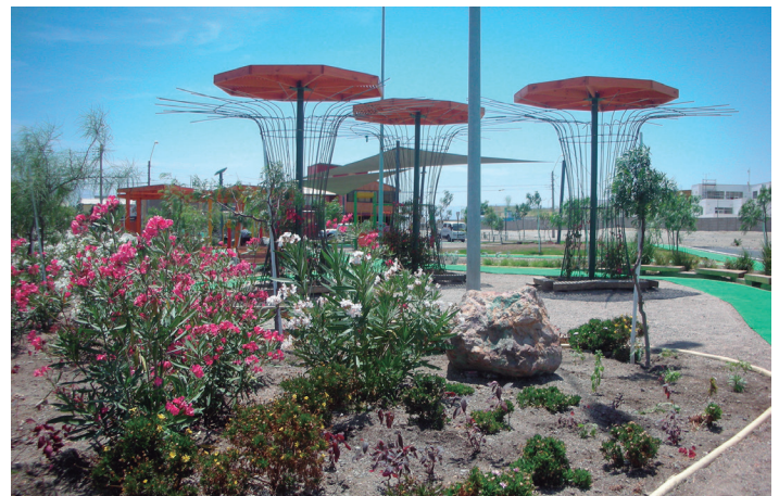
Plaza Oasis de Chacaya, Mejillones 2012