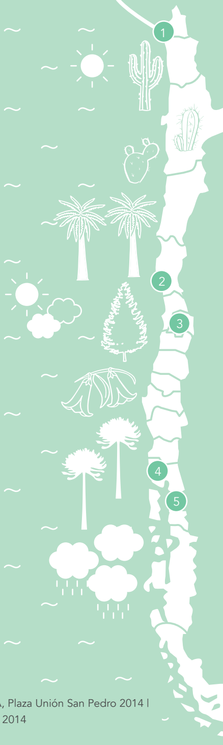
1. ARICA, Plaza Villa Azolas 2017 | 2. LOS VILOS, Plaza La Amistad 2016 | 3. LA FLORIDA, Plaza Unión San Pedro 2014 | 4. OSORNO, Plaza C. Ibáñez del Campo 2016 | 5. HORNOPIRÉN, Plaza Nuestro Parque 2014