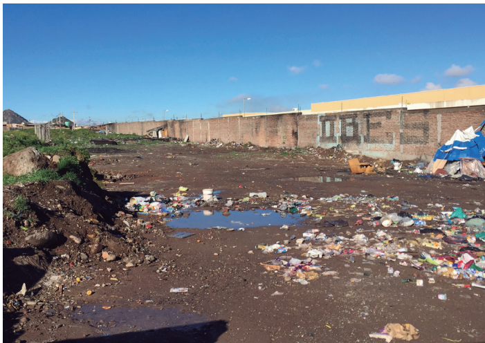
Terreno destinado a "La Plaza de Todos", San Bernardo 2017

Posteriormente se realiza un diagnóstico preliminar para verificar la factibilidad técnica y pertinencia social para realizar un proyecto en estos lugares, que por lo general son sitios baldíos o sin uso, pero designados para áreas verdes. La evaluación de la factibilidad técnica, tiene que ver con las dimensiones del espacio y el presupuesto del proyecto. El terreno debe contar con conexión de agua para su riego -medidor de agua potable- y compromisos de servicios de mantención municipal posterior a su construcción y activación. Por factibilidad o pertinencia social, se entiende que la comunidad quiera recibir el proyecto y exista un entramado social con el cual se pueda trabajar colaborativamente para el desarrollo del área verde, es decir que la plaza esté asociada a una comunidad. Esta etapa es fundamental para el desarrollo de los proyectos, pues de ésta depende la sustentabilidad de los proyectos que ejecuta Mi Parque.