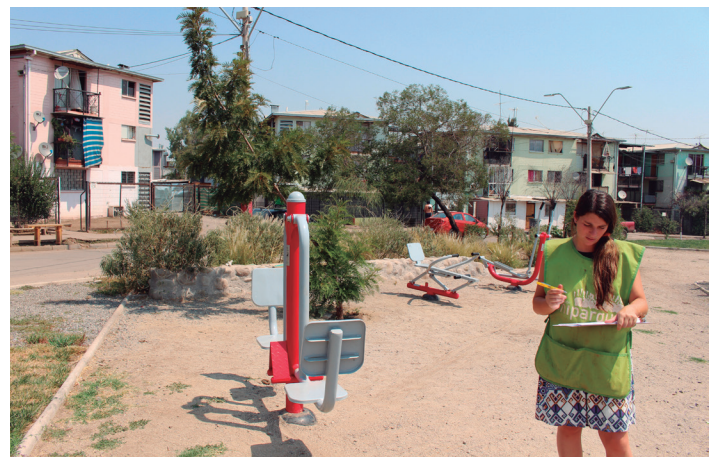
Seguimiento Plaza Orión, Colina