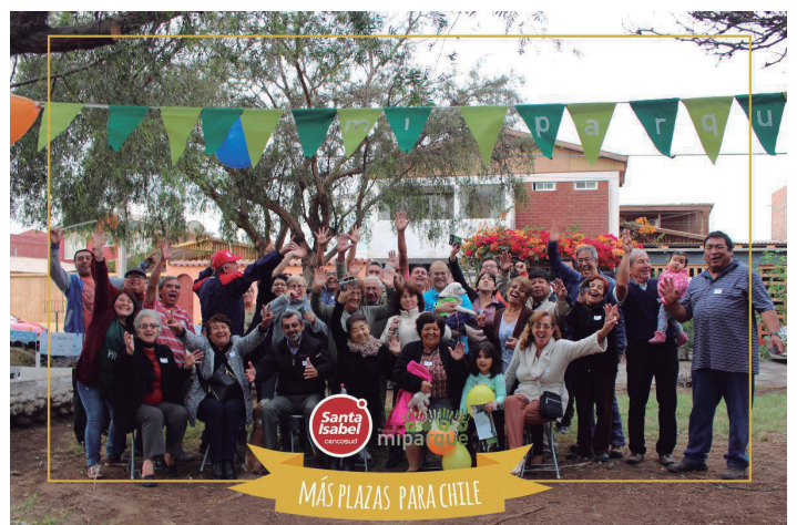
Comunidad ganadora de concurso "Más Plazas para Chile", 2016

Luego de una serie de reflexiones acerca del quehacer de la fundación, a fines de 2016 surge la necesidad de recapitular y revisar tanto la historia de la fundación como sus enfoques y dimensiones del modelo metodológico. En este marco, se propone desarrollar un proceso de sistematización que concrete el interés de Mi Parque por tener una reflexión continua sobre sus procesos, nudos críticos y aprendizajes.