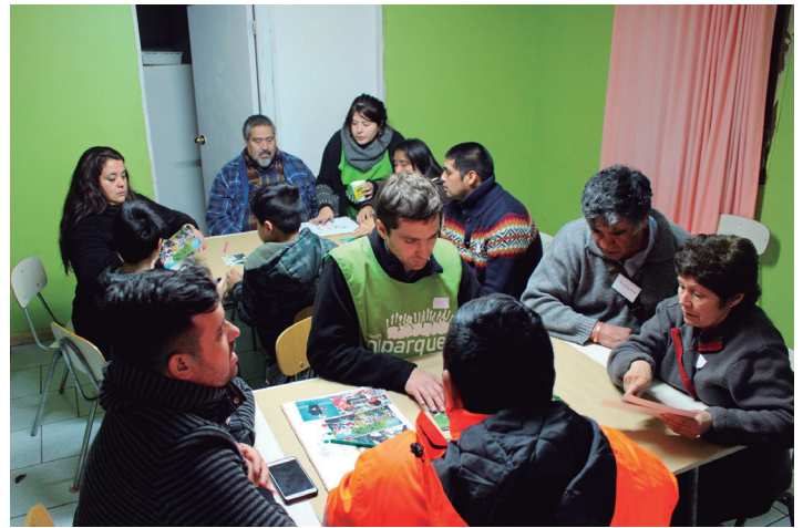
Taller participativo Plaza Alavinia Olivera, San Felipe

La historia y la identidad de la comunidad son elementos que permanecen a lo largo del proceso participativo. Se aspira entender el “lugar” como la convergencia entre el espacio físico y su contexto comunitario. Así por ejemplo, se desarrollan estrategias e intervenciones con la comunidad en el mismo lugar donde se recupera el área verde. Para ello, se instalan ciertas preguntas con la intención de que los vecinos se hagan parte de procesos participativos in situ. También se aplican otras estrategias, más vinculadas al análisis de los usos del espacio, como, por ejemplo,