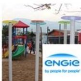
Jardín Infantil Bettemburgo | Huechuraba | Engie mayo 31, 2016