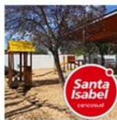
Jardín Infantil Diego Portales | Rancagua | Clientes de Santa Isabel agosto 31, 2016