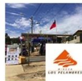
Plaza La Paz | Canela Baja, Coquimbo | Pelambres septiembre 28, 2016