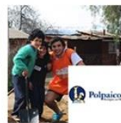
Parque Las Higueras | Til Til | Polpaico agosto 11, 2016