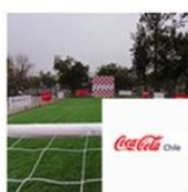
Cancha Complejo Deportivo | Renca | Coca Cola - Embotelladora Andina junio 14, 2016