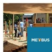
Jardín Infantil Las Rosas | Cerro Navia | Metbus noviembre 2, 2016