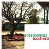
Jardín Infantil Principito | San Joaquín | Tresmontes Lucchetti septiembre 23, 2016