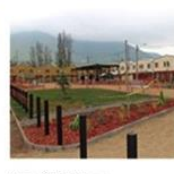
Jardín Plaza Benjamín Reineking | Lampa | Amigos de la Plaza septiembre 6, 2016