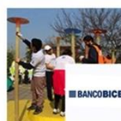
Colegio José Agustín Alfonso | Pedro Aguirre Cerda | Banco BICE agosto 2, 2016