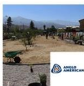
Plaza Cerros de Esmeralda | Colina | Anglo American febrero 12, 2016