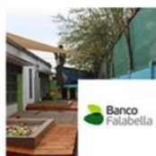
Jardín Infantil Pablo Neruda | Renca | Banco Falabella octubre 14, 2016