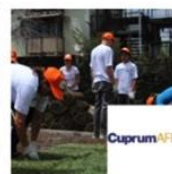
Plaza Orion | Colina | Cuprum enero 5, 2016