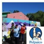
Plaza Huerto de los Sauces | Coronel | Polpaico marzo 23, 2016