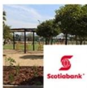
Plaza Amanda Molina | Colina | Scotiabank octubre 7, 2016