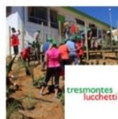
Jardín Infantil Rayén | Valparaíso | Tresmontes Lucchetti diciembre 20, 2016