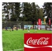
Complejo Recreativo Don Mario de los Chañares | Placilla | Coca Cola mayo 13, 2016