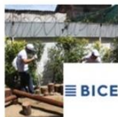
Colegio Jorge Alessandri Rodríguez | Renca | BICE noviembre 25, 2016