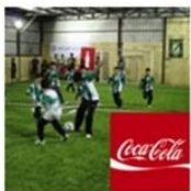
Complejo Recreativo Huguito Estay | Valparaíso | Coca-Cola abril 11, 2016