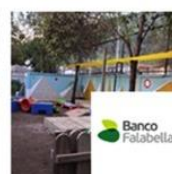
Jardín Infantil Las Azucenas (2a etapa) | Huechuraba | Banco Falabella junio 3, 2016