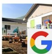
Jardín Infantil Bettemburgo (2a etapa) | Huechuraba