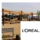
Plaza "De los Niños" | San Bernardo | L'Oréal noviembre 3, 2016