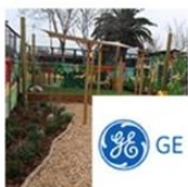
Jardín Infantil Mis Primeros Pasos | Pedro Aguirre Cerda | General Electric junio 2, 2016