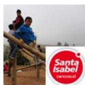
Plaza La Esperanza Viva | Valparaíso | Santa Isabel diciembre 20, 2016