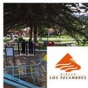
Plaza Santa Teresa de Ávila | Coquimbo | Pelambres septiembre 27, 2016