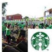
Colegio Cardenal Antonio Samoré | San Bernardo | Starbucks mayo 16, 2016