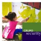
Plaza Los Quillayes | La Florida | Grupo Security noviembre 25, 2016