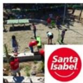
Plaza Renacer | Recoleta | Santa Isabel y sus clientes noviembre 23, 2016