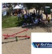
Parques de Velásquez | Lo Espejo | Red Viva, Autopista Central enero 22, 2016