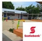
Jardín Infantil Pablo Neruda (segunda etapa) | Renca | Scotiabank noviembre 22, 2016