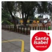
Plaza Juanita Aguirre | Conchalí | Santa Isabel mayo 12, 2016