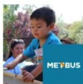
Jardín Infantil Carrusel | Cerro Navia | Metbus diciembre 7, 2016