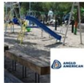
Plaza Santa Matilde | Til Til | Angloamerican mayo 9, 2016