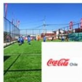
Complejo Recreativo Nueva México | Valparaíso | Coca Cola octubre 4, 2016