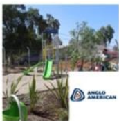
Complejo Recreativo San José | Huertos Familiares, Til-Til | Angloamerican marzo 30, 2016