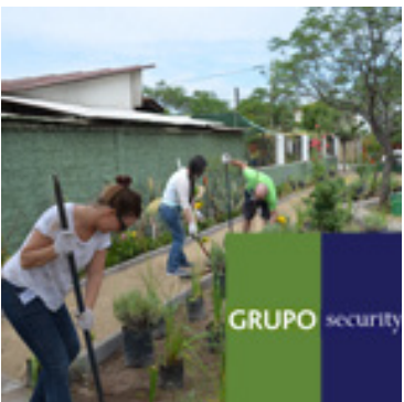
Plaza Unión San Paedro, La Florida Noviembre 28, 2014 | Grupo Security