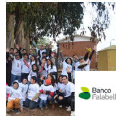
Plaza Orlando Peña Carvajal, Viña del Mar Junio 25, 2014 | Banco Falabella