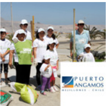
Arborización, Mejillones Diciembre 5, 2014 | Puerto Angamos