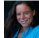
Bernardita Zaldívar Imagen y Diseño