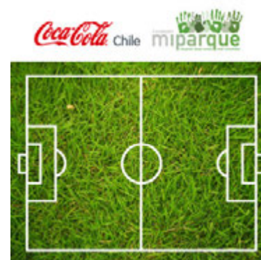
Canchas para Chile, 15 regiones de Chile Junio - Agosto | Coca-Cola