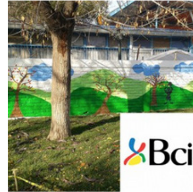
Jardín Infantil Gabriela Mistral, Conchalí Mayo 17, 2014