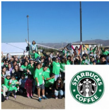
Plaza Fénix, Colina Abril 13, 2014 | Starbucks