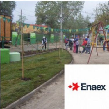
Plaza Estrellita Fuste, Huechuraba Abril 27, 2014 | Enaex