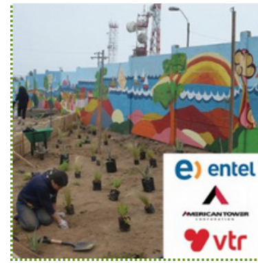
Parque Cerro de La Cruz, Quintero Mayo 11, 2014