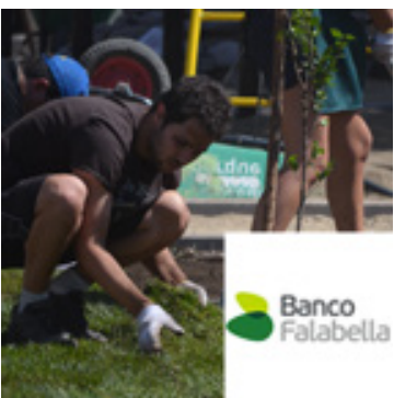
Plaza Renacer, La Florida Diciembre 17, 2014 | Banco Falabella