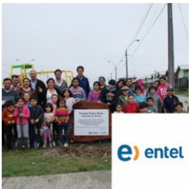
Parque Franz Renz, Puerto Montt Mayo 6, 2014 | Entel