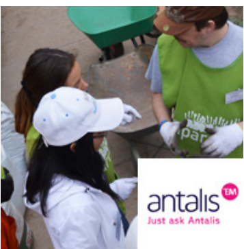
Jardín Infantil Sargento Candelaria, Huechuraba Diciembre 29, 2014 | Antalis