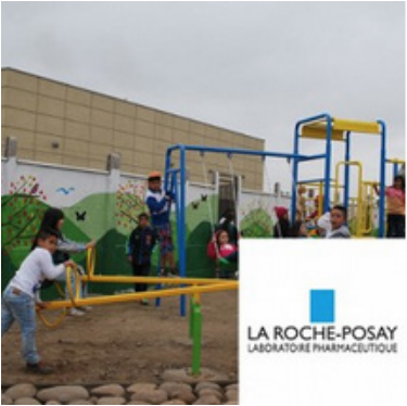
Plaza Monseñor Fresno, San Bernardo Abril 27, 2014 | La Roche Posay