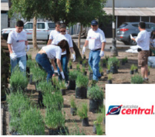
Plaza Masú el Cartero, 23 Noviembre 2013 Lo Espejo / 3.000 m 2