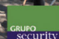
Parque Alameda, 5 Octubre 2013 La Florida / 1.750 m 2