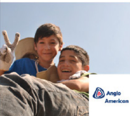
Plaza Los Placeres, 13 Diciembre 2013 Los Lingues / 1.600 m 2