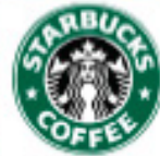
Plaza Finlandia, 27 Abril 2013 Pudahuel / 1300 m 2