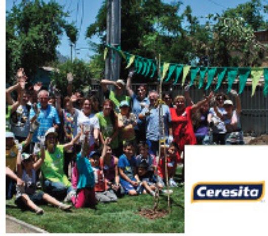
Plaza José María Caro / 7 Diciembre 2013 Recoleta / 850 m 2