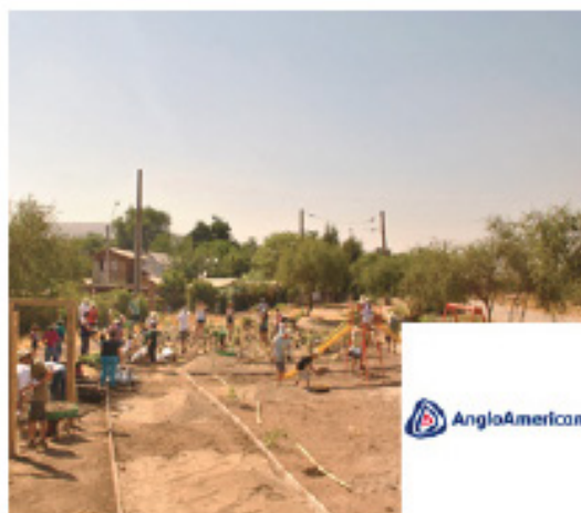
Parque Las Higueras / 21 Diciembre 2013 Polpaico / 6.500 m 2