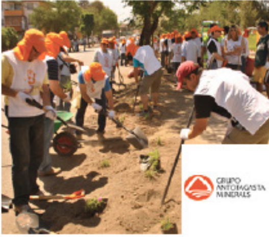
Plaza Nueva Vida, 29 Noviembre 2013 Independencia / 1.500 m 2