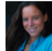
Bernardita Zaldívar Imagen y Diseño