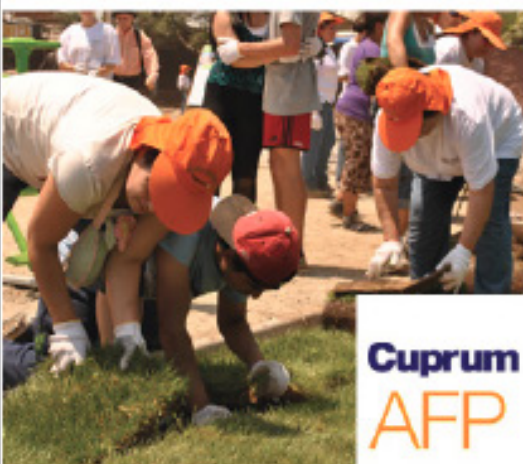
Plaza Los Eucaliptos, 18 Diciembre 2013 La Florida / 900 m 2