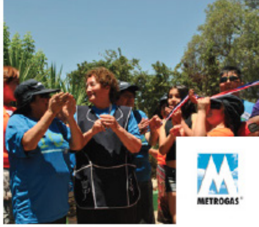
Plaza Violeta Parra, 30 Noviembre 2013 La Granja / 800 m 2