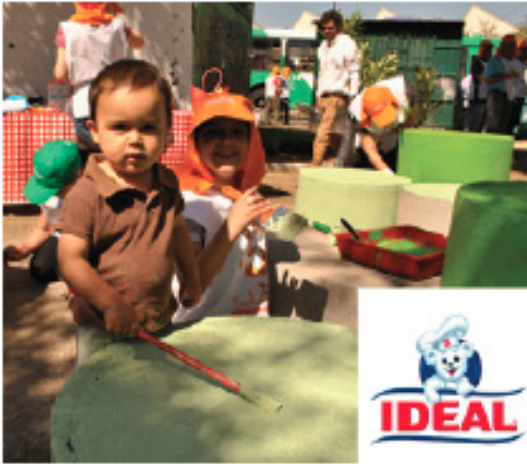
Plaza P. Hurtado, 30 Noviembre 2013 Curacavi / 700 m 2