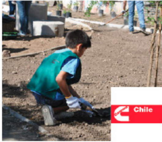
Plaza Peyflantun, 11 Diciembre 2013 Renca / 1.000 m 2