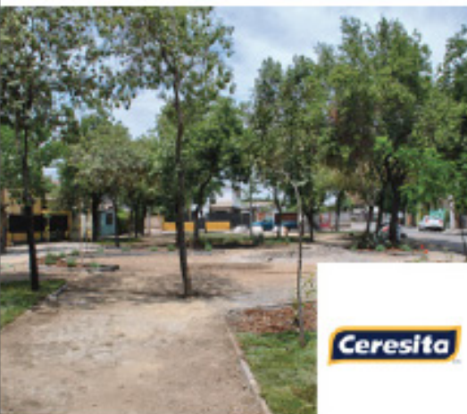
Plaza San Rafael / 8 Diciembre 2013 Recoleta / 590 m 2