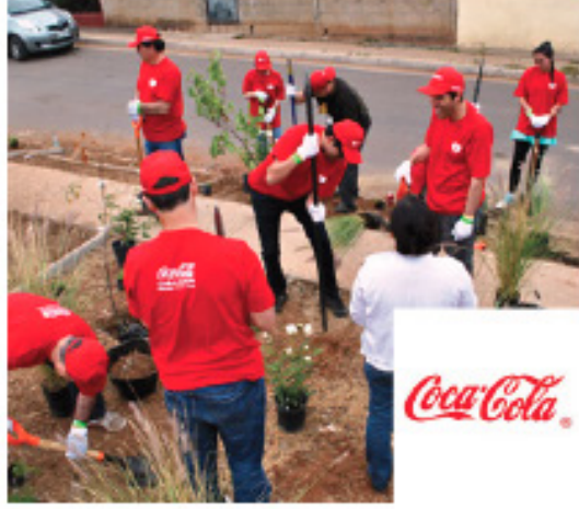
Plaza Armonía, 5 Diciembre 2013 Viña del Mar / 1.000 m 2