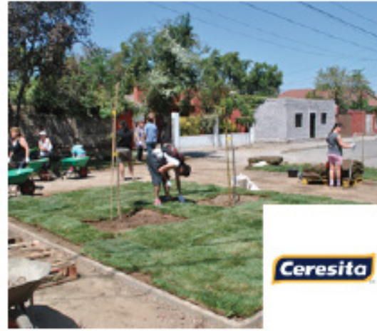
Plaza Con sistorial, 7 Diciembre 2013 Recoleta / 1.800 m 2