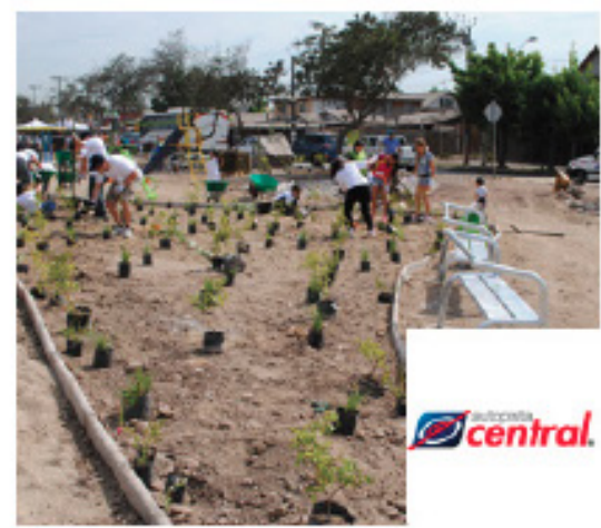
Plaza La Unión, 9 Noviembre 2013 Colina / 650 m 2